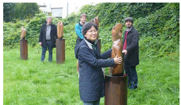
Die Aufstellung von Kunstobjekten in der Innenstadt ist über den Verfügungsfonds finanzierbar.

Wir freuen uns auf Ihre Ideen zur Stärkung der Innenstadt