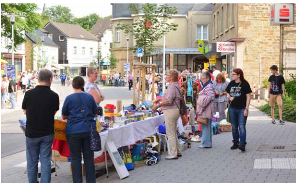
Viel los beim ersten Mondscheintrödel im Jahr 2015

Anmeldungen können ab sofort in der Bücherstube Draht (Bismarckstraße 52) erfolgen. Mit der Anmeldung ist dort auch die Standgebühr zu zahlen. Da der Trödelmarkt in kleinem Rahmen und nachbarschaftlich ablaufen soll, sind gewerbliche Händler und der Verkauf von Neuwaren nicht zugelassen. Weitere Informationen gibt es beim Citymanagement.