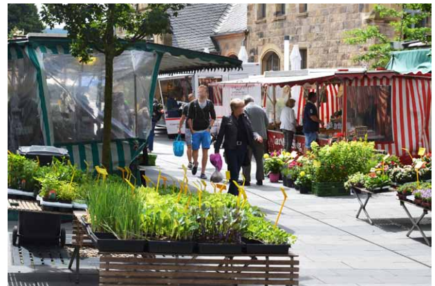
Vielfältiges Angebot auf dem Wetteraner Wochenmarkt

Zweimal pro Woche bietet der Wochenmarkt auf dem Bahnhofplatz in Alt-Wetter ein vielfältiges Angebot an frischen regionalen Produkten in bester Qualität und zu fairen Preisen. Jeweils mittwochs und samstags von 08:00–13:00 Uhr lässt sich dort alles finden, was man auf einem guten Wochenmarkt erwartet. Frisches Obst und Gemüse, Käse, Wurst, Fleisch, Fisch, Kartoffeln, Eier und Blumen.